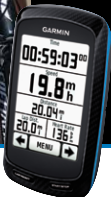
Edge 800 PACK (PN9800PACK) Avec capteur cadence et cardiaque

Edge 800 TOPO (PN9800TOPO) Avec carte TOPO SUISSE