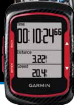
Edge 500 Rouge PACK (PN9500RPACK) Avec capteur cardiaque et capteur de vitesse/cadence