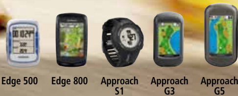
Edge 500 Edge 800 Approach S1 Approach G3 Approach G5