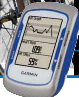
Edge 500 Bleu (PN9500)