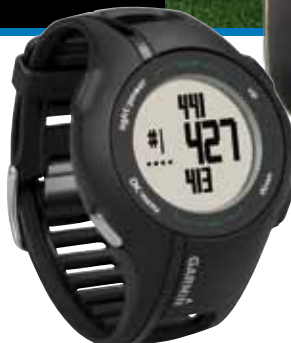
Approach S1 (PNS1)