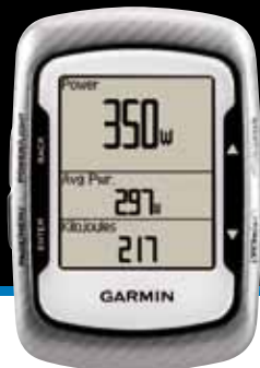
Edge 500 Carbone (PN9500C)