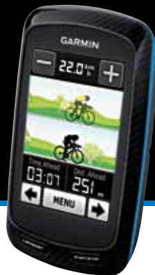
Edge 800 PACK City Nav (PN9800CN) Avec capteur cadence, cardiaque et carte routière Europe

Edge 800 PATO (PN9800PATO) Avec capteur cadence, cardiaque et carte TOPO SUISSE